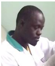
Dr El Hadji Niang

Votre implication pour répondre aux futurs défis sanitaires mondiaux est d'une importance vitale. Nous nous ferons un plaisir de discuter avec vous de la manière dont, ensemble, nous pouvons changer les choses en Afrique et pour l'Afrique.