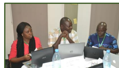
Participants à l'atelier, Sénégal 2017